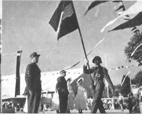
Die Fahne des Aarg. Kant. Uof-Verbandes