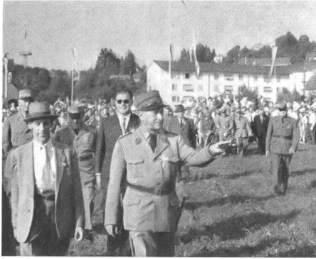
Oberstkorpskommandant Nager auf den Arbeitsplätzen