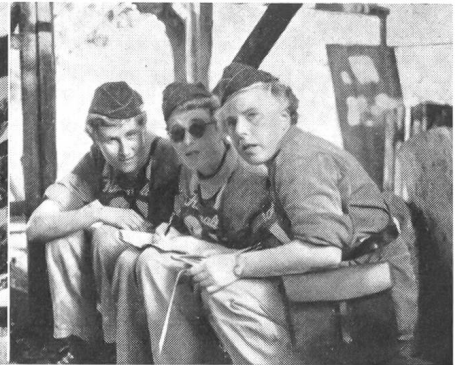
Eine der tüchtigen FHD-Patrouillen