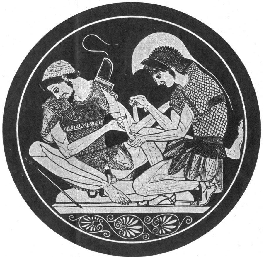
Abb. 1. Achilles verbindet die Pfeilwunde des Patroklos (sog. Sosias-Schale).

Wo ein Wille ist, da ist auch ein Weg, kann man auch hier feststellen. Allerdings mußten ungeheure Schwierigkeiten überwunden werden, um diesem Willen zum Durchbruch zu verhelfen. Die richtige, über bloße Erwägungen der Zweckmäßigkeit hinausführende Einstellung brachte erst die Ausbreitung des Christentums am Ende der Antike. Wir wollen nun an Hand einiger Ausschnitte verfolgen, wie sich das Prinzip der Nützlichkeits- und die Haltung der Opferbereitschaft den Weg gebahnt haben