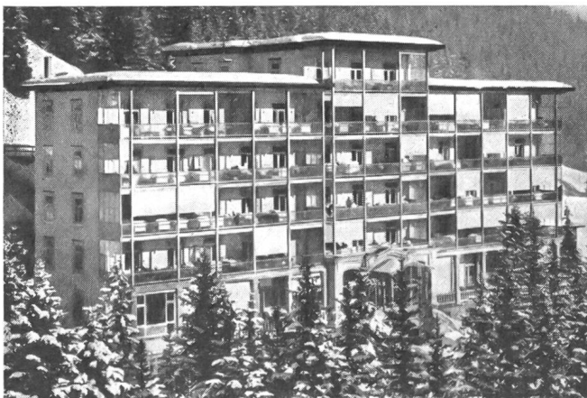
Eidg. Militärsanatorium Davos-Platz.

Im Rahmen dieses Aufsatzes können nun im weiteren nicht alle Bestimmungen des geltenden Gesetzes und ihre Auswirkungen in der Praxis erläutert und dargestellt werden. Es gilt, sich auf einige wenige grundsätzliche Probleme zu beschränken, wobei ich nicht unterlassen möchte, bei dieser Gelegenheit den Leser auf die kleine Broschüre zu verweisen, die der Bund Schweizer Militärpatienten vor wenigen Wochen herausgegeben hat. Diese trägt den Titel «Der Soldat schützt uns, wer schützt ihn?» und enthält in gedrängter Form unter anderem auch alles für den Militärpatienten Wissenswerte.