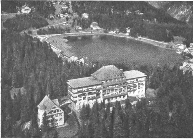
Eidg. Militärsanatorium Arosa.

1954 bei 2475 klagefähigen Verfügungen 171 Klagen bei den Versicherungsgerichten der Kantone eingereicht und 70 Entscheide erster Instanzen an das EVG weitergezogen.