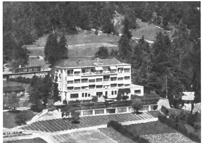
Clinique Militaire Montana.

Das zweite grundlegende Problem ist der sachliche Umfang der Versicherung, die Frage, nach welchen Grundsätzen die MV haftet. Hier unterscheidet das Gesetz nach dienstlichen, vordienstlichen und nachdienstlichen Gesundheitsschäden. Das ist so zu verstehen: