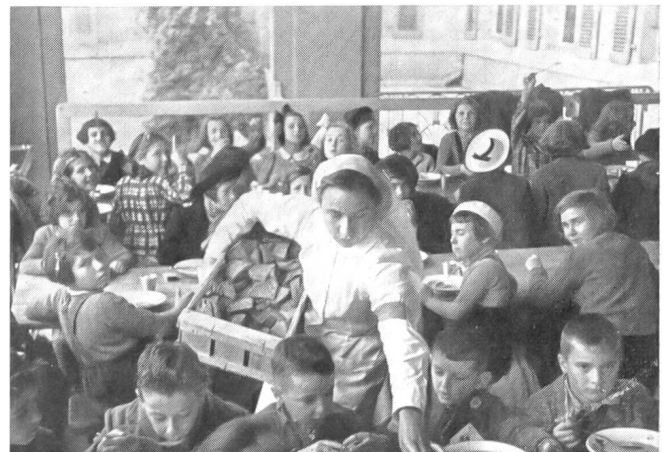
Brotverteilung an Flüchtlingskinder.