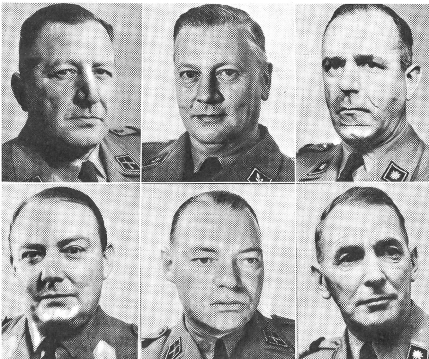
Neubesetzung von Kommandos der Armee