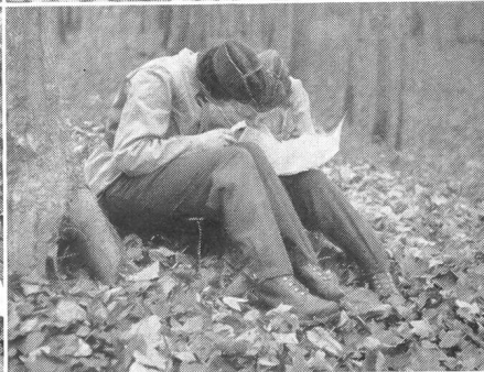
Einige Szenen aus dem Basler Militär-Patrouillenlauf