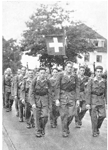
Die Schweiz am internationalen Viertagemarsch von Nijmegen.

Am internationalen Viertagemarsch von Nijmegen (Holland), der 13 000 Teilnehmer aus 21 Nationen vereinigte, legte auch eine Gruppe von rund 100 Schweizern die Gesamtdistanz von 160 km zurück. 7000 Teilnehmer erschienen in Uniform am Start. Unser Bild zeigt das militärische Detachement aus der Schweiz auf dem Dauermarsch.