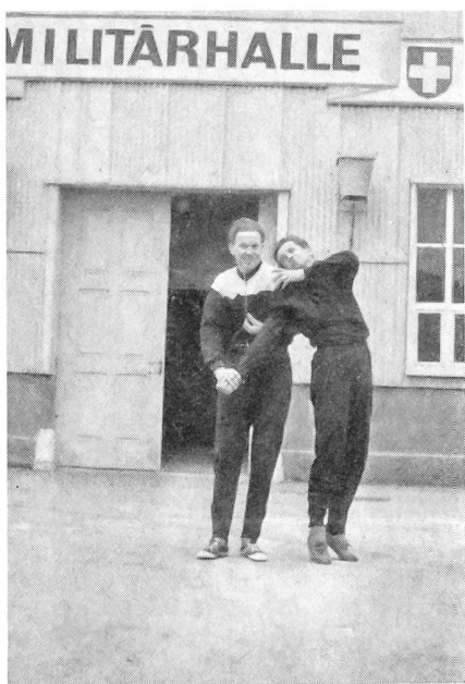
Der Hilfspolizist muß sich auch in Polizeigriffen auskennen.

Das Ergebnis der Körperschulung an den bisherigen Einführungskursen ist, gesamtlich betrachtet, erfreulich. Das Gros der Teilnehmer ist in der Lage, die Polizei bei entsprechenden Einsätzen zuverlässig zu assistieren, eine kleinere Gruppe bildet die Elite, während sich der Rest damit vertröstet, daß es im Leben (glücklicherweise!) noch andere Werte gibt als reine Muskelkraft.