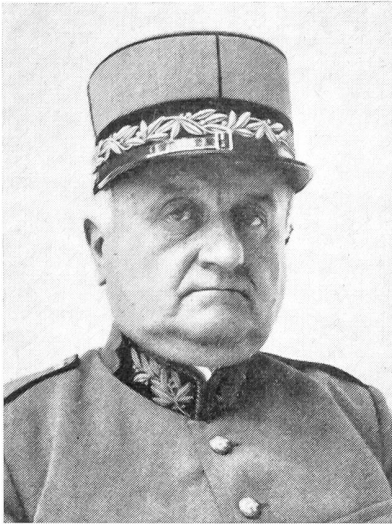
Eugen Bircher †