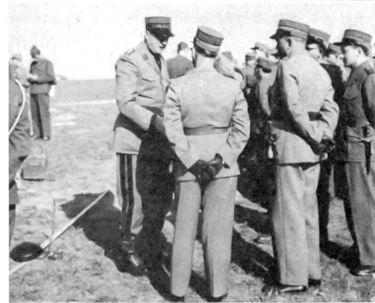
Zentralkurs SUOV Lausanne