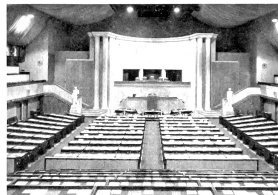
Salle du Conseil général Genève

L'assemblée des délégués sera déjà une première occasion aux genevois de démontrer à leurs camarades confédérés, comment ils seront accueillis par des amis qui mettent tout en œuvre pour leur permettre de garder de leur séjour à Genève, un souvenir impérissable.