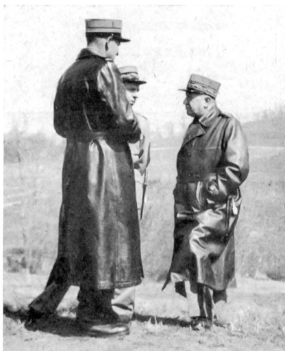
Zentralkurs SUOV Lausanne