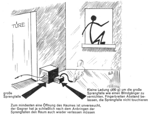
Zum mindesten eine Öffnung des Raumes ist unverseucht, der Gegner hat ja schließlich nach dem Anbringen der Sprengfallen den Raum auch wieder verlassen müssen