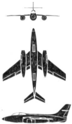
Vautour SO-4050 (Frankreich)