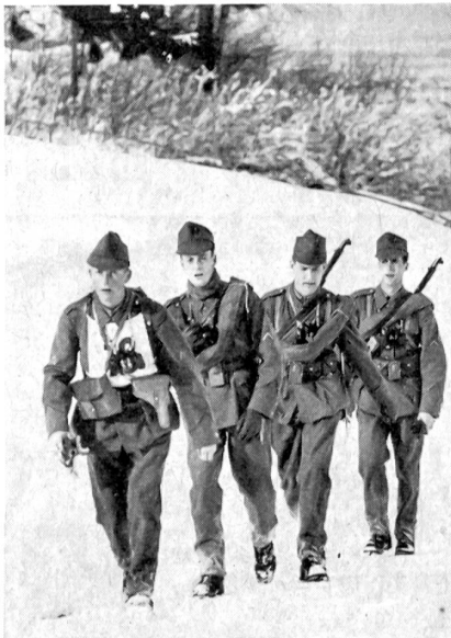
Eine Hochleistungsprüfung besonderer Art stellt in jeder Infanterie-Offiziersschule der 100-Kilometer-Marsch dar. Die gegenwärtig laufende Inf.-OS 6 führte diese außerordentlich strapaziöse Prüfung, gefechtsmäßig und in einem taktischen Rahmen aufgezogen, im Raume Payerne-Thun durch, wobei man von der Annahme ausging, daß sich eine Offizierspatrouille von einem abgeschnittenen Verband mit einer wichtigen Botschaft durch vom Feind besetztes Gebiet zu einem hohen Kommandanten durchzuschlagen habe.

Nachdem auch das Rechnungsbüro gut gearbeitet und alle Resultatlisten rasch vervielfältigt geliefert hatte, bildete am Sonntagnachmittag der vaterländische Weiheakt und die Rangverkündung den würdigen Abschluß der erfolgreichen «Weißen SUT» 1958. Den Reigen der kurzen Reden er-