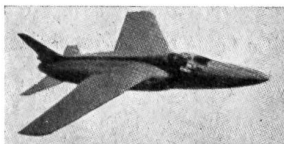
GROSSBRITANNIEN GNAT Folland

Gnat MK-1 flog erstmals im Sommer 1955. Er wird zurzeit von der finnischen und indischen Luftwaffe ausprobiert.