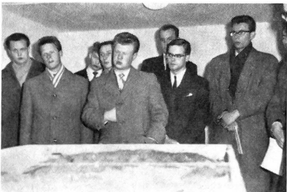
Die jungen Reserveleutnants der deutschen Bundeswehr folgen hier der Kampfgruppenführung am Sandkasten mit großem Interesse, um auf diese Weise einen instruktiven Einblick in die freiwillige außerdienstliche Tätigkeit unserer Kader zu erhalten. Es wurde ihnen nebst anderen Unterlagen auch der «Schweizer Soldat» und der Jahresbericht des SUOV 1957 abgegeben.