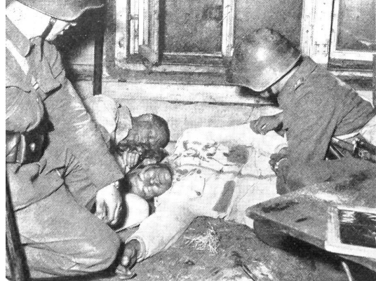
Die Luftschutztruppen sind bewußt der Beitrag der Armee an den zivilen Bevölkerungsschutz. Jeder Luftschutzsoldat ist auch im Sanitätsdienst ausgebildet, um helfen und retten zu können.