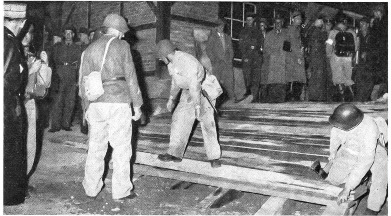
Luftschutztruppen im Einsatz