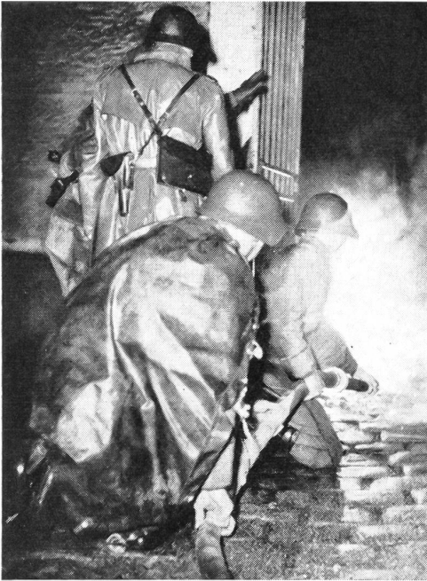
Im koordinierten Zusammenwirken von Wasser und Bewegung schützt hier eine Feuerwehrgruppe das Vorgehen der Kameraden der Rettungsgruppe.