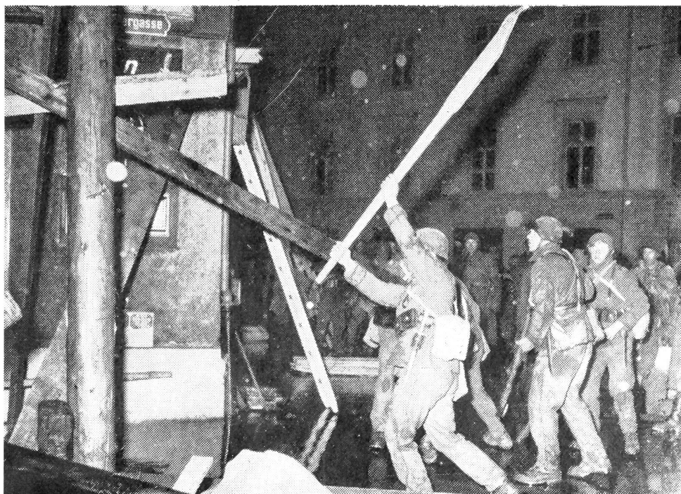
Rettung eines Verschütteten durch den Rettungstrupp

WK-Typ D. Hier liegt das Hauptgewicht in der Zugsausbildung in wirklichen Trümmern und Bränden. Dieser Typ kommt dem Typ A am nächsten, findet aber in einem dazu besonders ausgelesenen Objekt statt. Die Abteilung für Luftschutz sichert sich rechtzeitig solche Objekte, welche zum Abbruch bestimmt sind und schließt mit den Besitzern oder Bauherren entsprechende Verträge ab. Diese zum Abbruch bestimmten Objekte sind besser als Standardobjekte, weil sie richtig zerstört und in Brand gesetzt