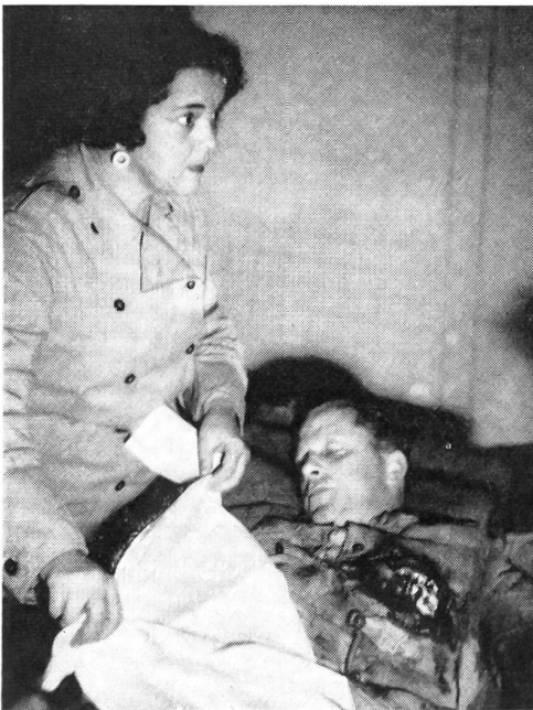
Geborgene Verschüttete und Verletzte werden durch die Luftschutztruppe sofort ärztlicher Betreuung zugeführt.