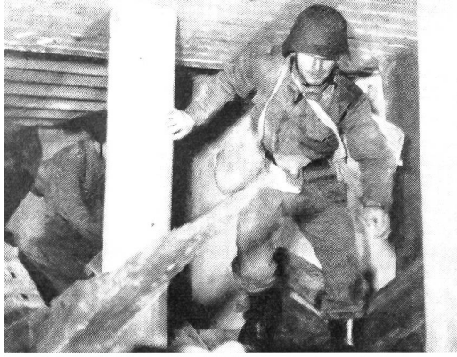
Das Vorgehen durch Trümmer, Flammen und Rauch stellt an die Luftschutztruppen in Ausbildung und Ausrüstung besondere Anforderungen.

werden können, währenddem Standardobjekte immer wieder aufgebaut werden müssen.