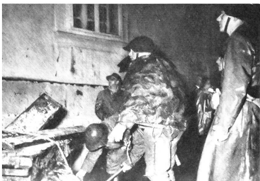
Durchbruch durch eine durch Trümmer verstopfte Straße.

immer ein Überfall ist. Es handelt sich damit für die Ls.Trp. darum, sich zusammen mit dem Zivilschutz auf diesen Überfall vorzubereiten, so daß bei Eintreten des Überfalles jeder gemäß vorsorglich erteilten Befehlen zunächst einmal selbständig handeln kann. Die Ls.Trp. stellen sich in sogenannten «Bereitstellungsräumen» bereit. Diese Bereitstellungsräume werden an der Peripherie der Stadt nach folgenden Gesichtspunkten gewählt: