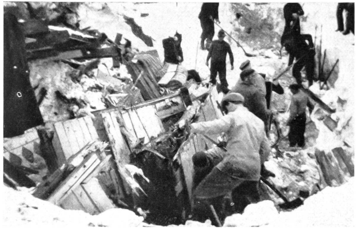
Die Luftschutztruppen helfen bei Lawinenkatastrophen