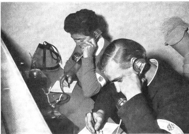
In den Alarmzentralen und Kommandoposten ist die Mitarbeit der Frau im Zivilschutz unentbehrlich geworden. Auch hier ist sie berufen, Männer zu ersetzen, die im Kampf und Rettungswerk einer betroffenen Ortschaft nützlichere Arbeit leisten können.

Sollte uns selbst einmal eine Atombombe treffen, so wird man all denen zu Hilfe kommen müssen, die in den Randzonen am Leben geblieben sind, aber nichts mehr besitzen. Ein Schutzraum in Hiroshima,