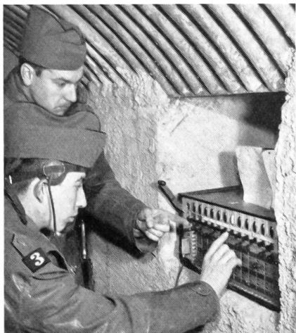
Im festgemauerten Unterstand bildet die Telefonzentrale den Knotenpunkt der Kabelverbindungen zur Front.

Der Verwendungsbereich von Fernschreiber, Fernzeichner und Fernsehen, als persönliche Kommandanten- oder als Stabsverbindung eingesetzt, sei kurz noch näher illustriert.