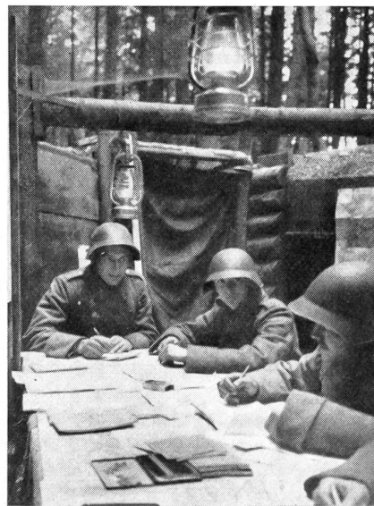
Kaum ist der Kommandoposten eingegraben, hat auch schon die Nachrichtenequipe die Arbeit aufgenommen. Sappeure erstellen erst noch das schützende Dach.

Um eine Verbindung herzustellen, bedarf es neben technischem Können, einer richtigen Beurteilung und Ausnützung des Geländes und nicht zuletzt der Fertigkeit im Gebrauch der Schußwaffe. Wer das elementare technische Verständnis nicht besitzt, geht als technischer Handlanger im Chor der Widerstände unter, und alles andere wird ihm nur zum Schein dienen. Die Aufstellung einer Nachrichtenanlage, die richtige Standortwahl der gesamten Um-techn.-Einrichtung, das frühzeitige Befehlen für den Einsatz der richtigen Übermittlungsmittel, die seriöse Improvisation in Krisenlagen wird der Kommandant nur einem Organ überlassen, das, seine taktische Absicht erkennend, die Mittel selbst fest in der Hand hält. Von Bedeutung ist eine wirklich kontinuierliche Auseinandersetzung mit der Entwicklung der Lage, eine nie abreißende denkerische Durchdringung des Kampferlaufes, um der Führung andauernd durch stete Anpassung des Befehls- und Nachrichtenapparates die Verbindungen sicherzustellen.