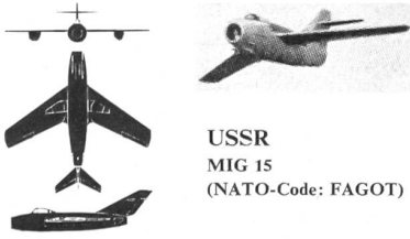
USSR MIG 15 (NATO-Code: FAGOT)

Der Mig 15 ist der erste russische Düsenjäger, der in Massenproduktion hergestellt wurde (über 10000 Stück). Während dem Korea-Krieg wurde er hauptsächlich gegen die amerikanischen Sabre eingesetzt.