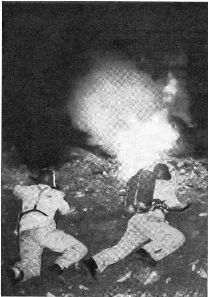
Flammenwerfereinsatz im nächtlichen Nahkampf (ATP)

dern auch der Drill in vernünftigen Maße erzieht sie unfehlbar zu harten, anspruchslosen Männern. Der ihnen eigene Angriffsschwung — in allen Kämpfen des letzten Krieges häufig erwiesen — hat neben der seelischen Einstellung seinen Ursprung in der gleichförmigen, straffen Exerzierausbildung. Wie stolz war ich als einfacher Soldat, wenn mich der Kompaniechef vor versammelter Mannschaft als den besten Marschierer auf dem Paradeplatz oder als den Mann mit dem zackigsten Präsentiergriff lobte! Strahlend stand ich dann Posten vor dem Offizierskasino in Moskau. Also, schaden kann diese an sich unkriegsmäßige Ausbildung keinesfalls, im Gegenteil, sie ist und bleibt eine Grundlage für die Erziehung zu wahren Soldatentum.»