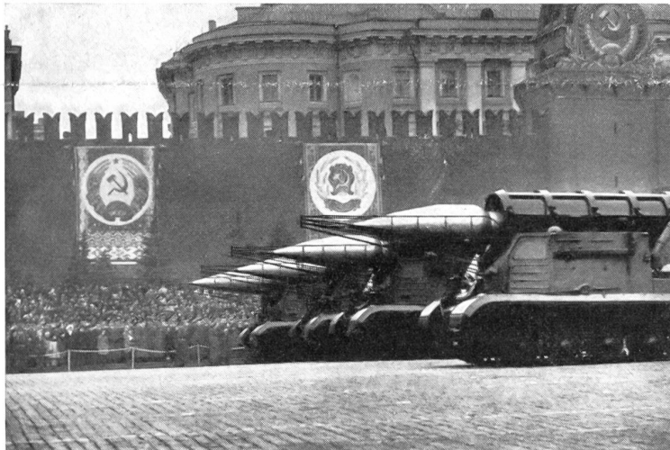
Panzerfeldraketenwerfer für un gelenkte Boden-Boden Raketen Typ 2 mit Feststofftreibsatz, Raketenlänge 9,5 m, 5000 kg Abschlußgewicht, 1200 kg Sprengstoff, aufwärts schwenkbares Mantelrohr mit Kälteschutzeinrichtung, 40 bis 50 km Reichweite, Fahrgestell des Panzer-typs JS III. (Aus dem großen Bild-Teil von «Landesverteidigung am Wendepunkt»)