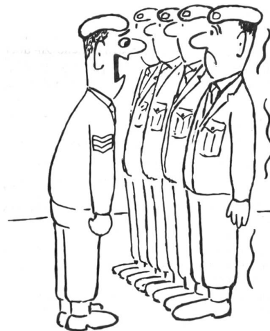
«Wer gab Ihnen Erlaubnis zu zittern?!» (Aus «Soldier»)