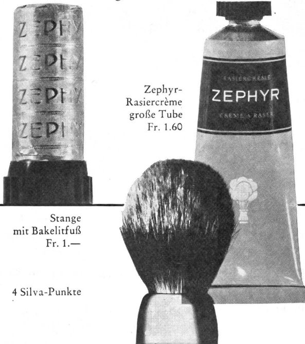
Zephyr- Rasiercreme große Tube Fr. 1.60

Ist die Haut auch sehr empfindlich mit ZEPHYR geht es schnell und gründlich!