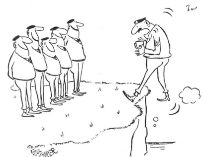
«Na also, Leute, auf dieses frohe Lächeln habe ich die ganze Zeit gewartet!» (Aus «Soldier»)