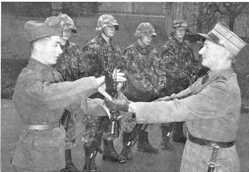
Das Sturmgewehr erstmals an Rekruten abgegeben

Im Rahmen der Abwehr atomarer Gefahren, die heute kein Land der Erde verschonen, ergeben sich für das hier geschilderte IDOS-Verfahren noch weitere An-