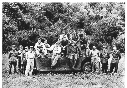
Der UOV Dümmerthal (SO) nach Abschluß seiner Panzerabwehrübung