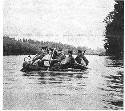
Der UOV Frauenfeld übt Flußüberquerung im Schlauchboot