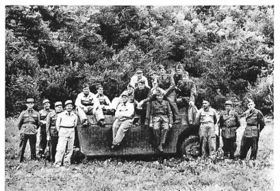
Der UOV Dümmerthal (SO) nach Abschluß seiner Panzerabwehrübung