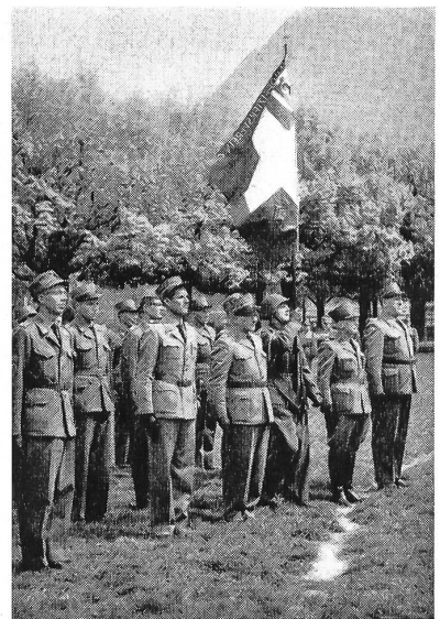
Unteroffiziersverein Chur mit der neuen Fahne

zwei kurze Stunden der kameradschaftlichen Verbundenheit von Gästen und Delegierten zu dienen, bis dann an diesem schönen Maientag zum Aufbruch geblasen werden mußte. Die flotte Arbeit in Chur und der imponierende Gesamteindruck haben dazu beigetragen, daß die Delegierten in ihren Unterverbänden und Sektionen mit Begeisterung und Initiative wieder an die Arbeit gehen und aus diesem Erlebnis auch die Kraft und den Mut schöpfen, Schwierigkeiten und Hindernisse zu überwinden. Die nächsten Schweizerischen Unteroffizierstage in Schaffhausen sind das leuchtende Ziel, dem heute aller Einsatz dienen muß.