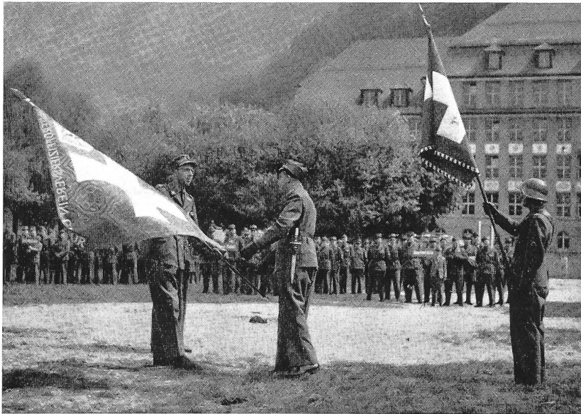
Der UOV Davos übergibt die neue Fahne dem UOV Chur

der Armee erhielten die verdiente Beachtung und Würdigung und fanden auch bei Gästen und Delegierten großen Beifall.