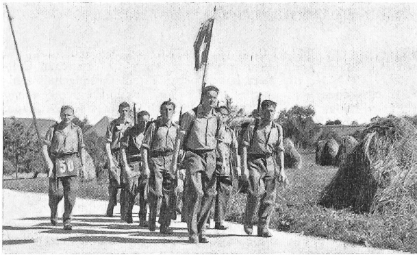
Der UOV Wiedlisbach marschierte stolz mit seiner Standarte durch das Bernbiet.