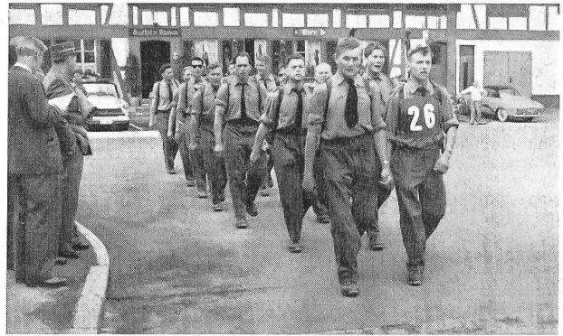
Durchmarsch in Worb am ersten Tag. Stolz und in guter Haltung marschiert der UOV Glatt- und Wehntal vorbei.

zu überbringen, der sich darüber freut, daß diese wertvolle Marschprüfung nach Holland nun auch in der Schweiz Eingang gefunden hat. Oberstkorpskommandant Frick anerkannte die gute Haltung der Marschgruppen, um gleichzeitig auch die große Bedeutung der Gruppenführung zu unterstreichen. Er dankte vor allem den Berner Organisatoren für die glanzvolle Initiative, die mustergültige Vorbereitung und Durchführung dieser neuen Formel außerdienstlicher Einsatzbereitschaft. Der Ausbildungschef der Armee sprach begeistert von seinem letztjährigen Besuch in Nijmegen, um dem Schweizer Zwei-Tage-Marsch auch in unserer Armee eine möglichst große Breitenentwicklung zu wünschen, und sich auch für eine großzügige Unterstützung dieser Bestrebungen auszusprechen.