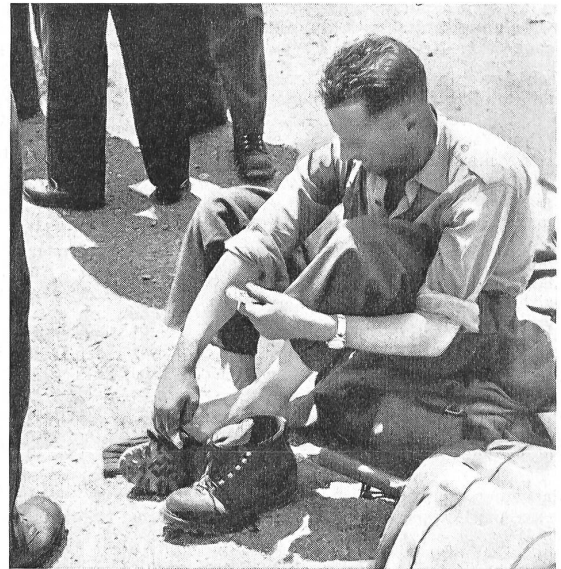
Die Fußpflege war die Hauptbeschäftigung aller Rasthalte, besonders am zweiten Marschtag.

Der zweite Schweizer Zwei-Tage-Marsch wird Anfang Juni 1961 organisiert und fällt in den Rahmen der Berner Hyspa, der großen Ausstellung für Hygiene, Volksgesundheit und Sport. Es ist vorgesehen, dazu Marschgruppen ausländischer Armeen einzuladen und die Militärkategorie durch eine Zivilkategorie zu ergänzen, um vor allem auch die Jugend für diese wertvolle und originelle Marschprüfung zu begeistern.