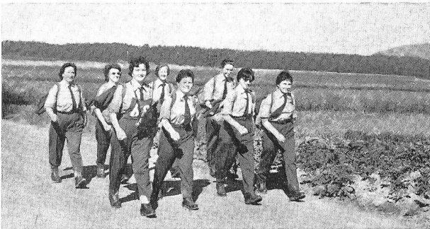
Einen flotten Eindruck hinterließ unterwegs die Marschgruppe der FHD.