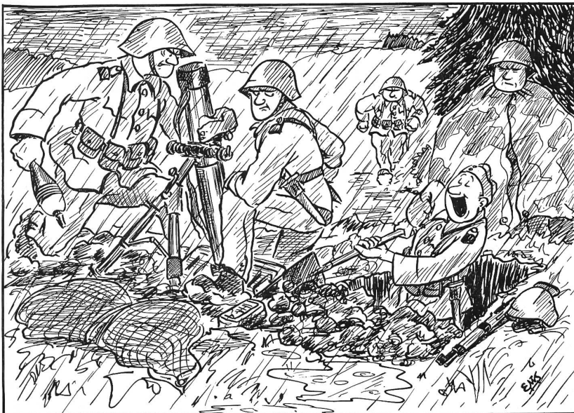
«Soldatenleben — hei das heißt lustig sein...!»