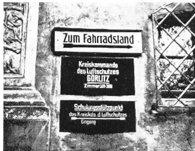
Schilder in der sowjetzonalen Stadt Görlitz

Während sich die Presse des Moskauer Statthalters, Ulbricht, in wilden Attacken «gegen die Atompolitik Adenauers und die Neugründung des faschistischen Reichs-