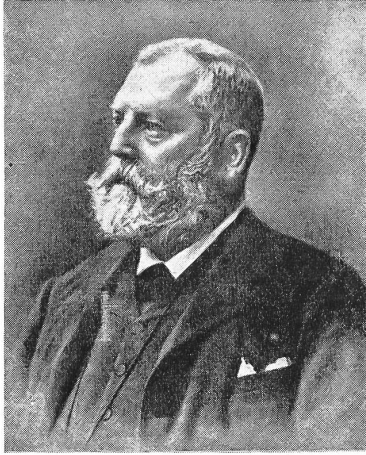
Bundesrat Emil Frey

In der Geschichte unseres Bundesstaates war keinem Bundesrat ein so abenteuerliches und bewegtes Leben beschieden wie Bundesrat Emil Frey. Aus einer alten Basler Soldatenfamilie stammend, die zur Söldnerzeit manchen hohen Offizier in fremden Diensten gestellt hat, fühlte Frey früh das alte Soldatenblut seiner Ahnen und zog schon in jungen Jahren nach Nordamerika. Hier machte er als freiwilliger Offizier in der Armee der Nordstaaten den Sezessionskrieg mit, fiel als Hauptmann in die Hände der Südstaaten, wo er lange in der Gefahr schwebte, als Geisel erschossen zu werden. Kurz vor Kriegsende wurde er ausgetauscht und wurde für seine tapfere Haltung vom amerikanischen Präsidenten zum Major befördert.