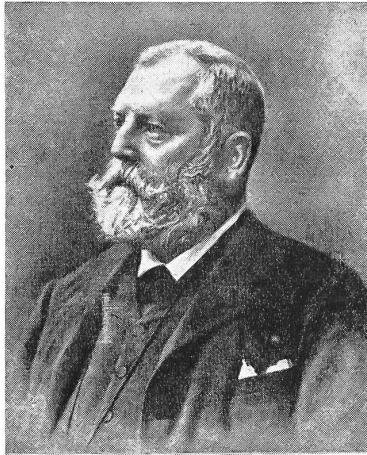
Bundesrat Emil Frey

In der Geschichte unseres Bundesstaates war keinem Bundesrat ein so abenteuerliches und bewegtes Leben beschieden wie Bundesrat Emil Frey. Aus einer alten Basler Soldatenfamilie stammend, die zur Söldnerzeit manchen hohen Offizier in fremden Diensten gestellt hat, fühlte Frey früh das alte Soldatenblut seiner Ahnen und zog schon in jungen Jahren nach Nordamerika. Hier machte er als freiwilliger Offizier in der Armee der Nordstaaten den Sezessionskrieg mit, fiel als Hauptmann in die Hände der Südstaaten, wo er lange in der Gefahr schwebte, als Geisel erschossen zu werden. Kurz vor Kriegsende wurde er ausgetauscht und wurde für seine tapfere Haltung vom amerikanischen Präsidenten zum Major befördert.