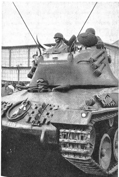
Der Pz. 58 anlässlich der Pressevorführung in Thun

Der Panzer zeichnet sich vorab durch eine bei seiner Stärke auffallend günstige Silhouette aus und bietet daher mit seinen fließenden Linien weniger Angriffsfläche als der Centurion, obwohl seine Bewaffnung und Panzerung als gleichwertig zu bezeichnen ist. Wanne und Turm sind aus Stahl gegossen und bieten einer Besatzung von vier Mann genügend Raum. Die Bewaffnung besteht aus einer 9-cm-Kanone, einemrohrparallelen Schnellfeuergeschütz von 20 mm Kaliber und einem Maschinengewehr für die Nahverteidigung. Bei einer maximalen Geschwindigkeit von 50 Stundenkilometern beträgt das Gefechtsgewicht 35 Tonnen, während der Panzer eine Länge von 655 cm, eine Breite von 302 cm und eine Höhe von 265 cm aufweist. Die maximale, an der Demonstration bewiesene Steigfähigkeit, beträgt 70 Prozent, während Hindernisse bis zu 75 cm Höhe überklettert, Gräben und Bäche bis 280 cm Breite über-