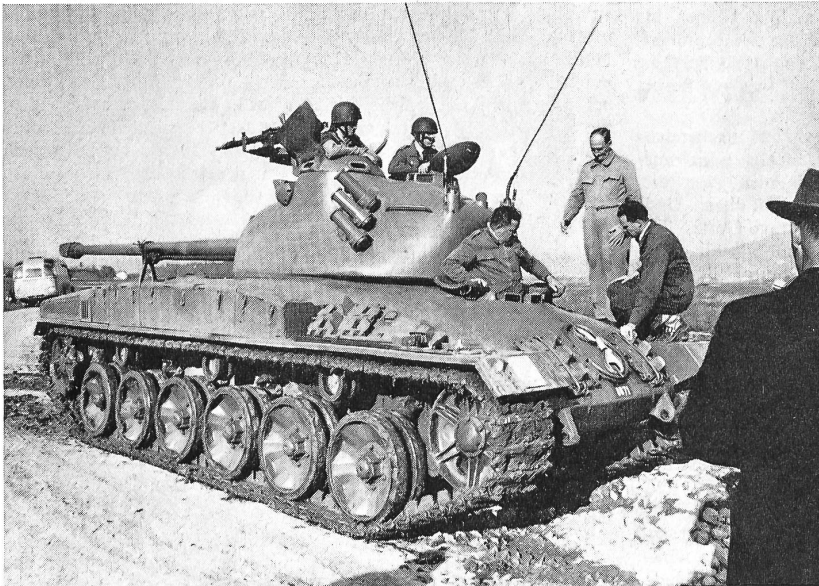
Bundesrat Chaudet als Panzerfahrer. Der Chef des EMD hat sich in Thun selbst von den guten Eigenschaften des Pz. 58 überzeugt, um sich bei einer Fahrprobe auch über die guten Lenk- und Fahreigenschaften zu vergewissern

In der Eigenentwicklung wurde nach einem Panzer gesucht, der in der Tonnage zwischen den 15 Tonnen des AMX und dem Centurion mit seinen 50 Tonnen liegt, mit seinen Kampfeigenschaften aber die Qualitäten eines mittelschweren Panzers erreicht. In enger Zusammenarbeit zwischen den Eidgenössischen Konstruktionswerkstät-