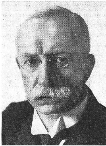
Bundesrat Arthur Hoffmann

Das Wort ist abgeleitet von dem italienischen cavallo (lateinisch caballus ), womit ein zu den verschiedensten Diensten verwendetes Pferd bezeichnet wird. Aus cavallo entstand das italienische cavalleria , das «Reiterei» bedeutet, und das gleichbedeutende französische cavalerie . Letzteres verdrängte im 16. Jahrhundert die deutschen Ausdrücke «Reuterei», «Reutterschaft», «der reisig hauffen», «der reisige Zeug», «die Hauffen zu Roß», «Kriegsvolk zu Pferd» und ähnliche. 1569 taucht es in deutschen Zeitungen auf; im brandenburgischen Heere kam es im 17. Jahrhundert in Ge-