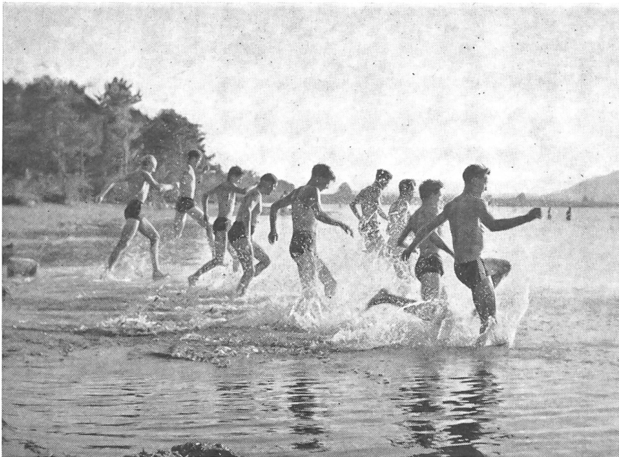
Gesunde, mitreißende Lebensfreude. Ein Vorunterrichtskurs der ETS erfrischt sich am Ufer des Bielersees.

dem Vaterlande nützliche Bürger zu erziehen, und zwar «als feste Stützen» sowohl für die Zeit des Friedens als auch für die Zeit der Not. «Das allgemeine Wohl des Vaterlandes» war als Zielpunkt angegeben, in welchem alle turnerischen Bestrebungen übereinstimmen. Diese Gründung glückte im Jahre 1833 am zweiten schweizerischen Turnfest in Zürich den dortigen Turnern gemeinsam mit ihren Freunden von Bern und Aarau. Die junge Turnerschaft war ein Vortrupp auf dem Marsch zum Bundesstaat 1848. Gleich den Sängern und Schützen bezeugten sie, daß echten Vereinen eine hohe und unwiderstehliche Kraft innewohnen kann. Möchten sich die geltungssüchtigen Vereinsmeier von heute doch immer wieder an diese Möglichkeit erinnern!