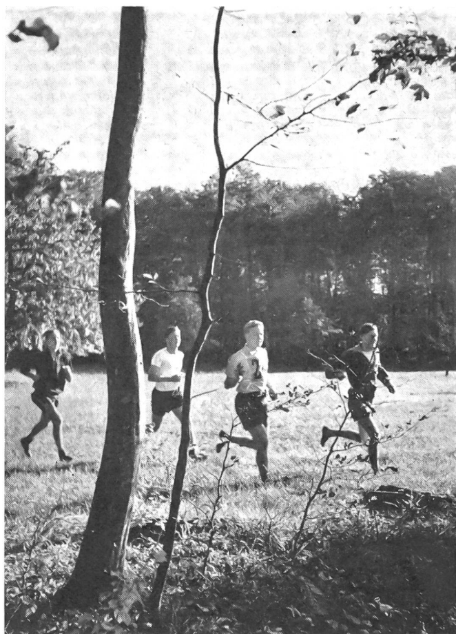
Dem Orientierungslauf, der zum Ausbildungsprogramm der ETS in Magglingen gehört, öffnen die bewaldeten Höhen über dem Bielersee zahlreiche Möglichkeiten, um mit immer wieder neuen Aus- und Durchblicken auch die Schönheit unserer Heimat kennen und schätzen zu lernen.

Unser Wort Gymnastik weist nach Griechenland. Gymnasium hieß bei den Griechen ursprünglich die Sportanlage, wo sich die freigebornen Knaben und Jünglinge ohne behindernde Kleider — gymnos heißt nackt — im Fünfkampf, d. h. im Lauf, Sprung und Ringkampf sowie im Werfen von Diskus und Speer, übten. Seit den Perserkriegen traten immer mehr geistige und musische Fächer dazu, so daß der Name Gymnasium schließlich für die gesamte Bildungsstätte erweitert wurde. Dabei forderte Platon das gesunde Gleichgewicht der beiden Erziehungsarten. «Wer sich ausschließlich körperlich bildet, wird allzu roh; wer sich auf musische Bildung beschränkt, wird weichlicher, als ihm gut ist», heißt es im dritten Buche über den Staat. «Wer aber die rechte Harmonie (von Körper und Seele) erreicht hat, dessen Seele wird dann sowohl tapfer als auch besonnen.» Gewiß fehlte es auch damals nicht an anderen Männern, welche, wie Philostratos, das Athletentum befürworteten. Schon die Olympischen Spiele mit der hohen Ehrung der Sieger, denen man zu Hause gleich Statuen errichtete, leisteten dieser Gefahr Vorschub, wenn