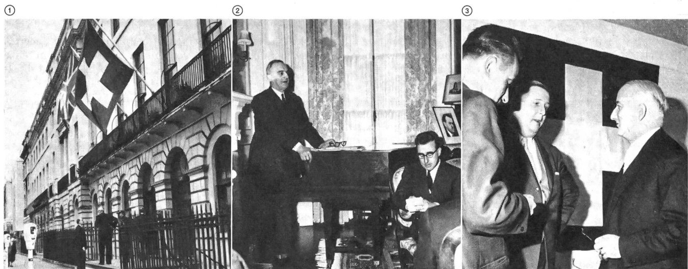
① Zu Ehren des Journalistenbesuches aus der Heimat wehte am Gebäude des bekannten College der Swiss Mercantile Society neben den Farben Englands auch die Schweizer Fahne. ② Der schweizerische Botschafter in London, Minister Däniker, bei der Begrüßung und Orientierung der Gäste. Im Vordergrund der Präsident der Vereinigung der Bundeshausjournalisten, Frank Bridel. Hptm. i. Gst. ③ Bridel ist auch Mitglied der Presse- und Propagandakommission im SUOV. ④ Der Berichterstatter im Gespräch mit dem schweizerischen Militärattaché in London, Oberst i. Gst. Mosimann.