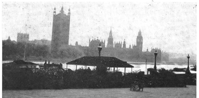
Das atehrwürdige englische Parlament — Houses of Parliament — in dem die Schweizer Journalisten einer Debatte im Unterhaus beiwohnten. An einem durch das Außenministerium gegebenen Empfang bot sich auch Gelegenheit, mit Parlamentariern und Journalisten direkt ins Gespräch zu kommen.

Seit Kriegsende schafft der immer stärkere Zustrom junger Leute vielfältige Probleme, und wenn diese nicht gelöst werden, machen sich die Folgen bemerkbar bis in die Zivilstandsämter unserer Kantone und Gemeinden. Zu erwähnen sind da beispielsweise die Vaterschafts-Nachforschungen — etwa 50 jährlich — von denen ein gutes Drittel mit der Geburt von Mulattenkindern zusammenhängen. Dies ist jedoch nur ein Teil der Gefahren, die der Schweizer Jugend in London drohen. Ohne Zweifel würden Demütigungen und Unglück dieser Art eine weit größere Zahl von Angehörigen in der Schweiz treffen, bestünde nicht in London ein «Swiss Hostel for Girls», das kurz nach Kriegsende mit Hilfe bedeutender Zuwendungen an die «Swiss Benevolent Society» geschaffen wurde, und ohne den tatkräftigen Fürsorgedienst, der von zwei sehr tüchtigen, aus der Schweiz stammenden Berufs-Fürsorgerinnen geleitet wird. Dieser Fürsorgedienst unterstand ursprünglich ganz der «Swiss Benevolent Society»; als diese jedoch der Belastung nicht mehr gewachsen war, beschlossen die Bundesbehörden und der Schweizer Verein der Freundinnen junger Mädchen, die Kosten durch einen jährlichen Beitrag von 15 000 Franken