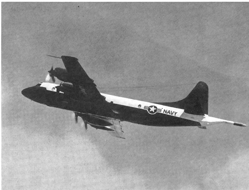
Amerikas neuester U-Boot-Jäger

Amerikas neuester U-Boot-Jäger, der Lockheed P 3 V-1 «Orion», wird jetzt von der Marine zum verstärkten Küstenschutz eingesetzt. Der «Orion» hat acht Mann Besatzung und eine Reihe modernster Elektronikgeräte an Bord, die feindliche U-Boote auf große Entfernung hin registrieren können. Das Flugzeug führt außerdem Wasserbomben, Torpedos und Luftwasserraketen mit sich. Der «Orion» ersetzt den «Neptun», der viele Jahre der Standard-U-Boot-Jäger der amerikanischen Marine war und 16 Jahre produziert wurde. Tic