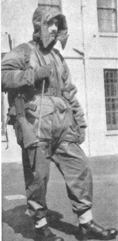
Neue und veränderte Uniformen...

der britischen Streitkräfte wurden nach einer Besichtigung durch die Königin in London der Presse vorgeführt. Insgesamt waren 21 verschiedene Uniformarten zu sehen, darunter sechs Uniformen für weibliche Angehörige der Streitkräfte. Besonderes Interesse fand der neue Winter-Kampfanzug der Infanterie (unser Bild). (key)