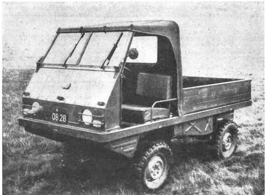
Gegenwärtig werden in unserer Armee zwei neue Gefechtsfeld-Fahrzeuge erprobt. Unser Bild zeigt das Fahrzeug der österreichischen Firmen Steyr-Puch. Es ist ausgerüstet mit einem Zweizylinder-Boxermotor von 22 PS und einem Fünfganggetriebe. Dieses Fahrzeug mit vier Sitzplätzen, wovon zwei versenkt werden können, kann auch für den zivilen Bedarf verwendet werden.