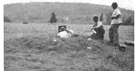
Pz.-Abwehr-Wettkampf des UOV Frauenfeld