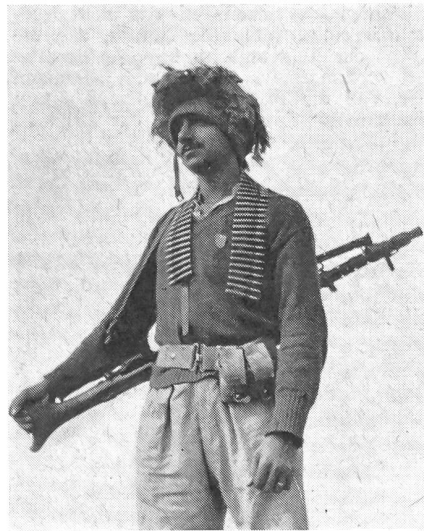
Ein typischer Hagana-Krieger, Ende 1948.

Beide Gruppen vertraten die Ansicht, daß nur extremer Terror die Engländer aus dem Land vertreiben könnte. Ihre Auffassung setzten sie auch in Wirklichkeit um, bis sie nach dem Entstehen des Staates Israel aufgelöst wurden.