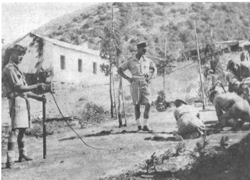
Im Sommer 1946 suchten die Briten fieberhaft nach verborgenen Waffen.