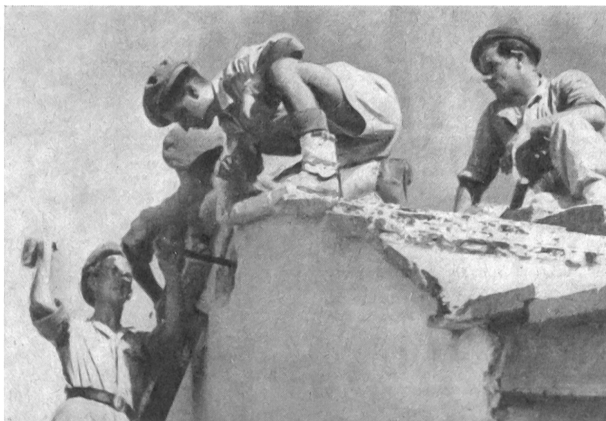
Die Briten durchsuchen Mauern und Hauswände im Kibbutz Givath Chaim bei Hedera nach Waffen. Sommer 1946.

Am Ende des zweiten Weltkrieges waren ungefähr 25 000 Freiwillige in britischen Diensten. Männer und Frauen waren mobilisiert, und zwar von einer Bevölkerung von kaum mehr als einer halben Million. Diese Tatsache fiel um so mehr auf, als sich von arabischer Seite fast keine Freiwilligen ge-