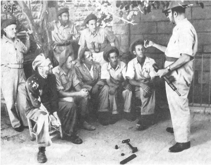
Instruktionsstunde der Hagana in Jerusalem bei Ausbruch der Unruhen vor dem Schützengrabenbau an sehr exponiertem Posten im Negev, Ende 1948.

gen. So gelang es ihnen, sich beinahe ohne jede Hilfe von außen selbst zu erhalten. Kurz vor dem Befreiungskrieg zählte der Palmach 2000 mobilisierte und etwa 1000 Miliz-Mitglieder.