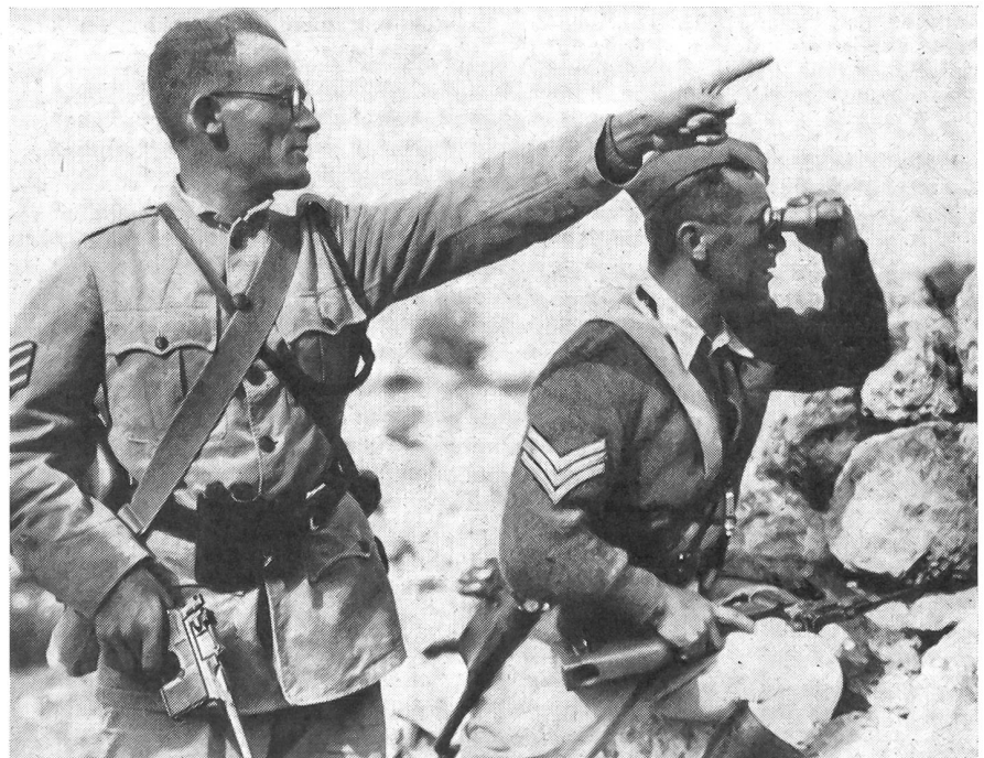
Jüdische Wachtmeister der «Nachtbataillone», Kdt. Captain Wingate, beobachten arabische Banden im Erez Israel während der Unruhen von 1936—1939

Sehr schnell zeitigte diese Aufhetzung ihre traurigen Ergebnisse. Im Winter 1920 griffen die Araber Tel Chai, einen entlegenen Punkt im oberen Galiläa, an, und die wenigen Verteidiger mußten wegen schwerer Verluste den Platz räumen. Einen Monat später kam es durch die von fanatischen Priestern aufgehetzten Araber in Jerusalem zu blutigen Ausschreitungen. Nach diesen Unruhen in Jerusalem häuften sich auch die Fälle von Angriffen auf die jüdischen Siedlungen im Galiläa und im Süden. Aber den Höhepunkt erreichten diese im Juni 1921. Am 1. Mai 1921 fand in Jaffa eine friedliche Demonstration jüdischer Arbeiter zum Tag der allgemeinen Arbeitsbewegung statt. Die Araber der Umgebung begannen sich zusammenzurotten und gingen dann zu einem Massenangriff auf die jüdischen Arbeiter über, von denen mehr als vierzig, die