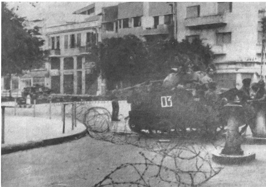
1947. Englischer Tank in Tel Aviv anlässlich der Verkündigung des dreitägigen Kriegszustands. So sah es im Zentrum der Stadt aus.

im Immigrationsheim in Jaffa lebten, getötet wurden. Außerdem wurde eine Reihe weiterer Juden, die an isolierten Punkten in Jaffa wohnten, ermordet. Unter ihnen auch der Dichter J. Ch. Brenner.