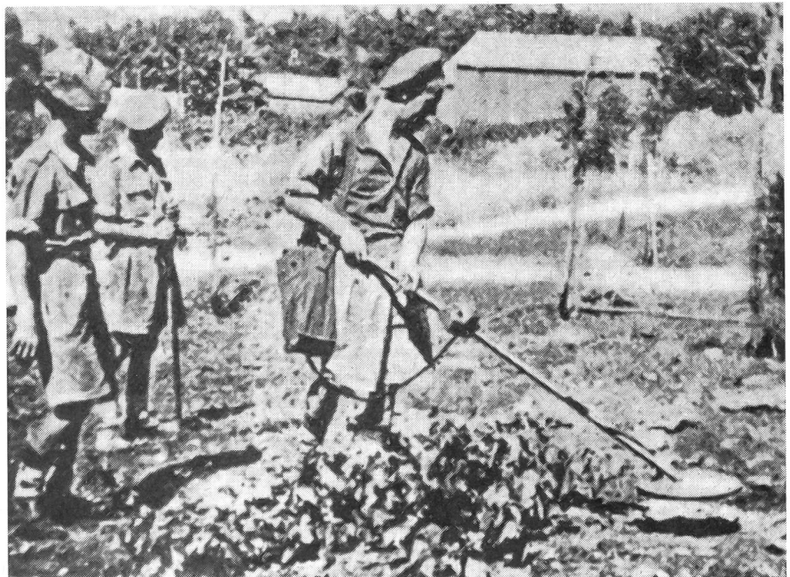
Die Briten suchen nach Waffen der Hagana in landwirtschaftlichen Siedlungen. Sommer 1946.

Alle diese Erfahrungen wurden in der Hagana ausgewertet und bestimmten wesentlich das Bild des jüdischen Kämpfers. Hauptmann Wingate, der im Lande von der jüdischen Bevölkerung nur «der Freund» genannt wurde, zeichnete sich auch im zweiten