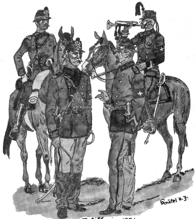
Artillerie 1884 Offizier Fahrer Wachmeister Trompeter

bildeten und bewaffneten Kompanien. Die Scharfschützen wurden nicht mehr besonders rekrutiert. Bis 1891 behielten sie noch den Repetierstutzer (Mod. Vetterli 1871); von da an erhielten sie auch das gleiche kleinkalibrige Infanteriegewehr. Schließlich erinnerte nur noch der grüne Rock an die versunkene Schützenherrlichkeit.