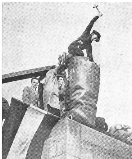
Die erbitterte Arbeiterschaft war es, die das große Stalinendenkmal in Budapest umlegte und hier dabei ist, auch die Bronzestiefel des kommunistischen Diktators in Stücke zu schlagen.