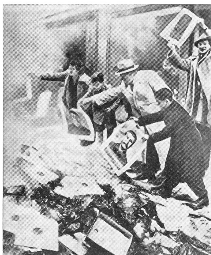
Die verhaßten Bilder und Bücher, Tonnen von kommunistischem Propagandamaterial wurden verbrannt, während sich das Volk in den ersten Strahlen der jungen Freiheit sonnte, die Moskau nach der Untätigkeit der freien Welt so blutig zusammenschlug.