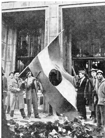
Sichel und Hammer, das verhaßte kommunistische Symbol der Unfreiheit, wurde von den Freiheitskämpfern aus den ungarischen Fahnen gerissen.