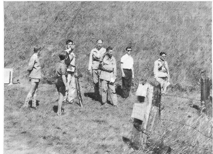
Distanzschätzen: Mit dem Daumen oder nach «Guet Gmeint»