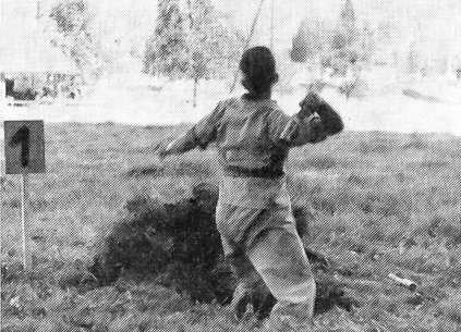
Aus der Deckung wird eine HG in den Graben geworfen.