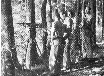
Geländepunktbestimmen aus einem Gefechtsstand.