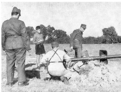
Rak.Rohr-Schießen: Auch der Jungwächter verfolgt die Manipulationen.