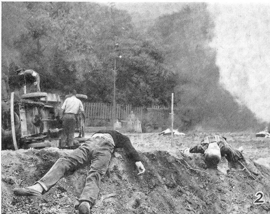
Mit Schweden ist auch der Zivilschutz in Norwegen in Organisation und Ausrüstung kriegsgenügend ausgebaut, um materiell und personell nicht hinter den Anstrengungen der militärischen Landesverteidigung zurückzustehen. Hier ein Bild von einer der zahlreichen realistisch aufgezogenen Zivilschutzübungen in Norwegen.

Versicherung: Das OK versichert alle Wettkämpfer und Funktionäre, die nicht Mitglied des SUOV sind, gegen Unfall.