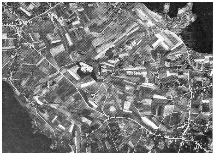
Luftbild der Straße Ettiswil-Großwangen.

Für diese Aufgabe, wo es um die Säuberung der Häusergruppe von Bognau und der Verhinderung des Ausweichens feindlicher Kräfte ging, sind wiederum aus 80 Sektionen über 700 Arbeiten eingegangen. Die Lösung dieser Aufgabe läßt verschiedene Möglichkeiten zu, soweit den taktischen Grundsätzen gefolgt wird und die zur Verfügung stehenden Mittel nicht verzettelt werden und die Mitr. Gruppe einen sinnvollen und auch geländemäßig lösbaren Auftrag erhält. Wir veröffentlichen umseitig eine der möglichen Lösungen, von der bei konsequenter Durchführung auch ein Erfolg erwartet werden darf.