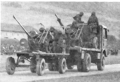
Inf.Flav-Gruppe mit improvisierter Selbstfahrlafettierung

Im nächsten Teil wurde man über die Organisation des Funk- und Telephon-