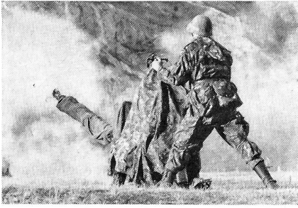
Flabkanone S 4 im Gefechtseinsatz.

stolz ihre Geräte und Waffen sowie die dazugehörigen Munitionsorten und deren Wirkung an getroffenen Zielen. Sämtliche Tenuearten, von der Ausgangsuniform bis zum Kampfanzug mit seinen unzähligen praktischen Taschen, und eine vollständige Auslegeordnung rundeten den interessanten Überblick ab, während ein aus Kanonieren zusammengesetztes Schulorchester unermüdlich für den musikalischen Rahmen besorgt war.