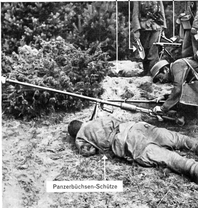
Kdt. Füs.Bat. 33

Mg. für Sturm und Einbruch auf Vorderstütze