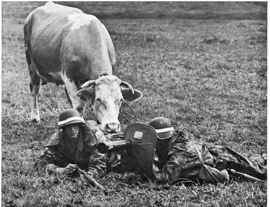
«Der unfreiwillige Humor kommt auch im Gefechte vor!»